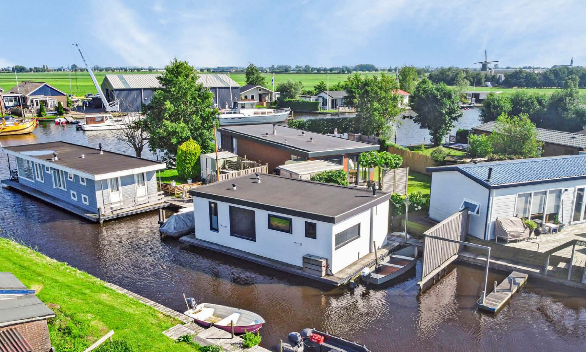
Poeldijk 13 W10, Rijpwetering