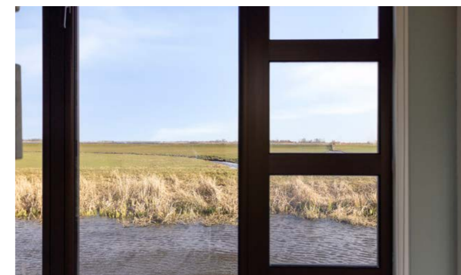
Hemmeerpolder 13, Warmond