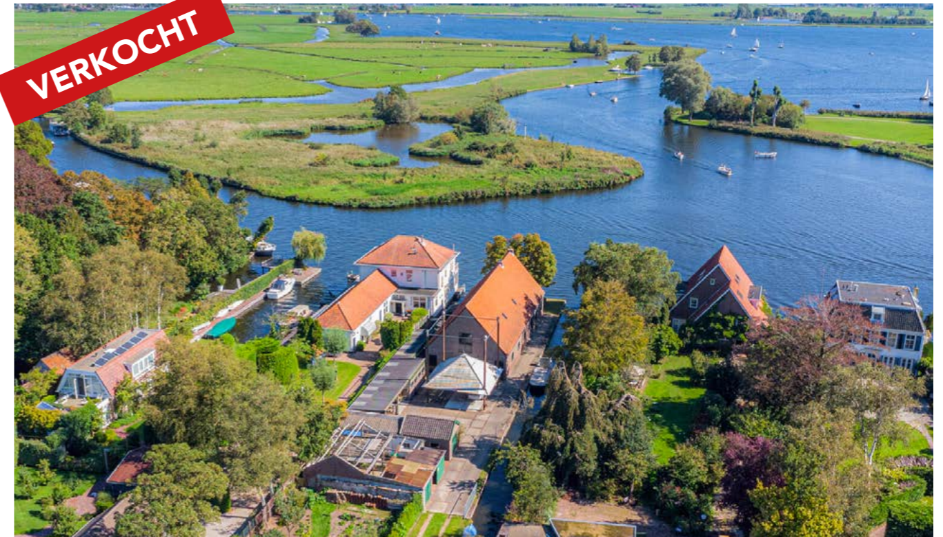
Dorpsstraat 87, Warmond