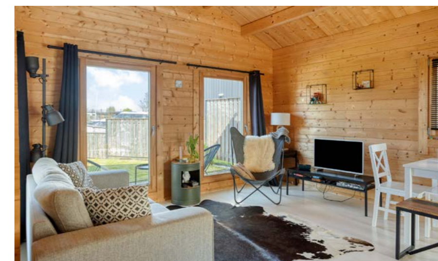
Poeldijk 13 Z2, Rijpwetering