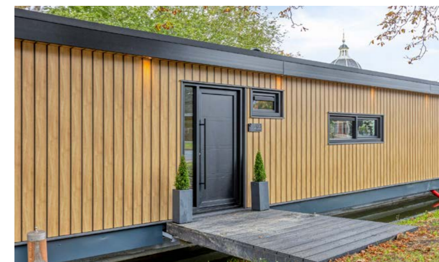
Morssingel 306, Leiden