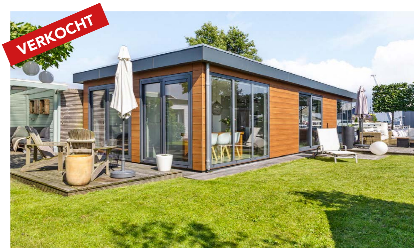
Poeldijk 13 W11, Rijpwetering