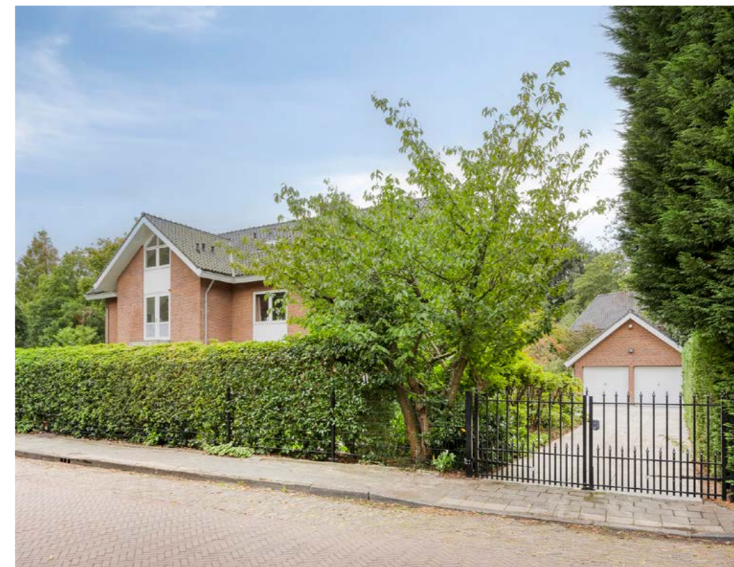
Berkenlaan 1, Wassenaar