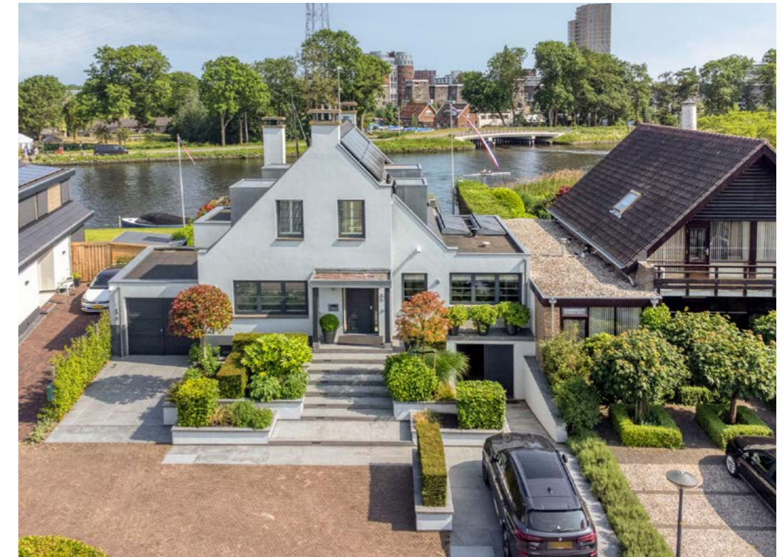
Brigantijnwal 9, Leiden