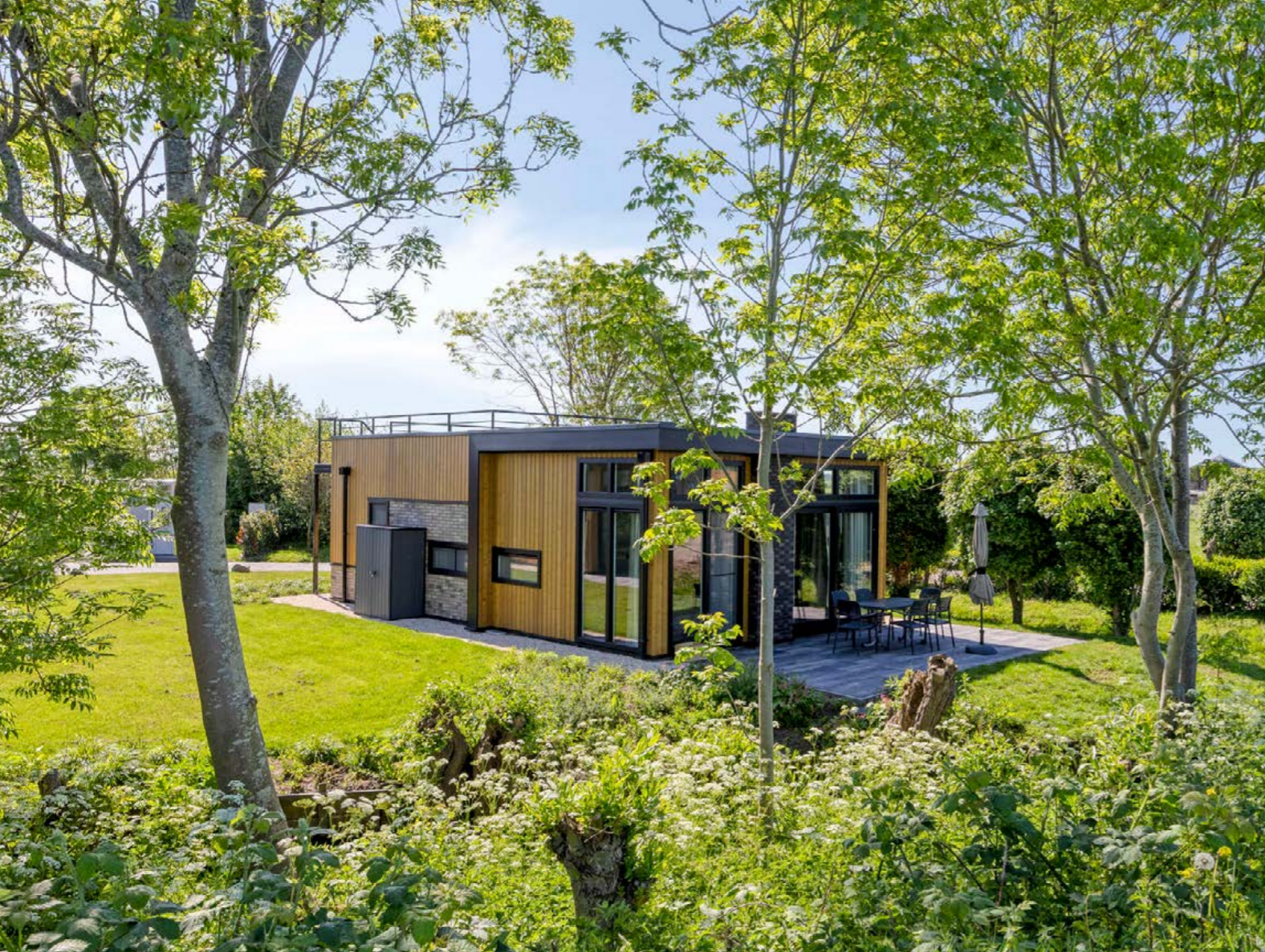
Boekhorsterweg 21, woning 200 Warmond