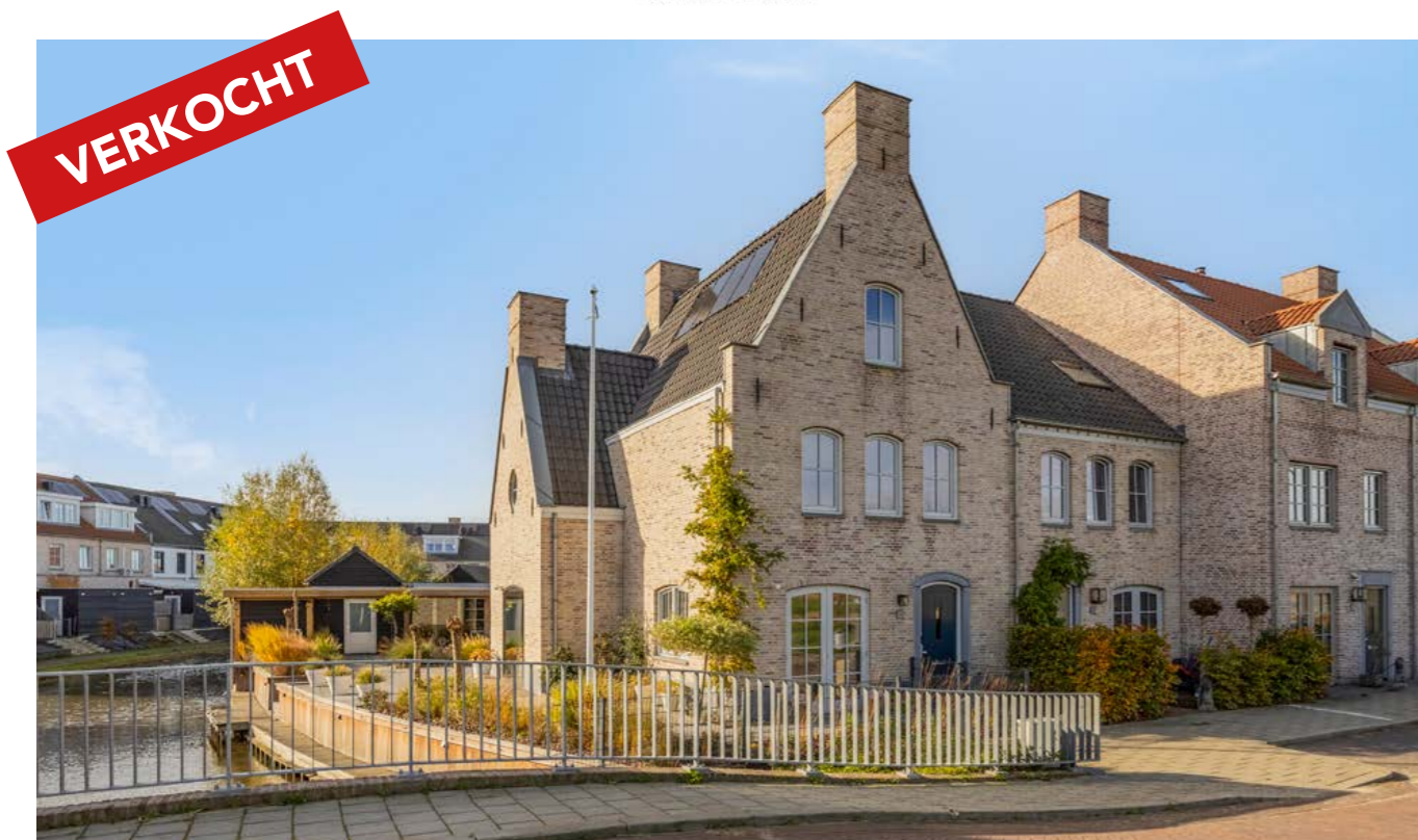
Clovislaan 31, Rijnsburg