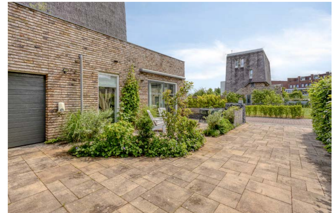
Maalderij 7, Leiderdorp