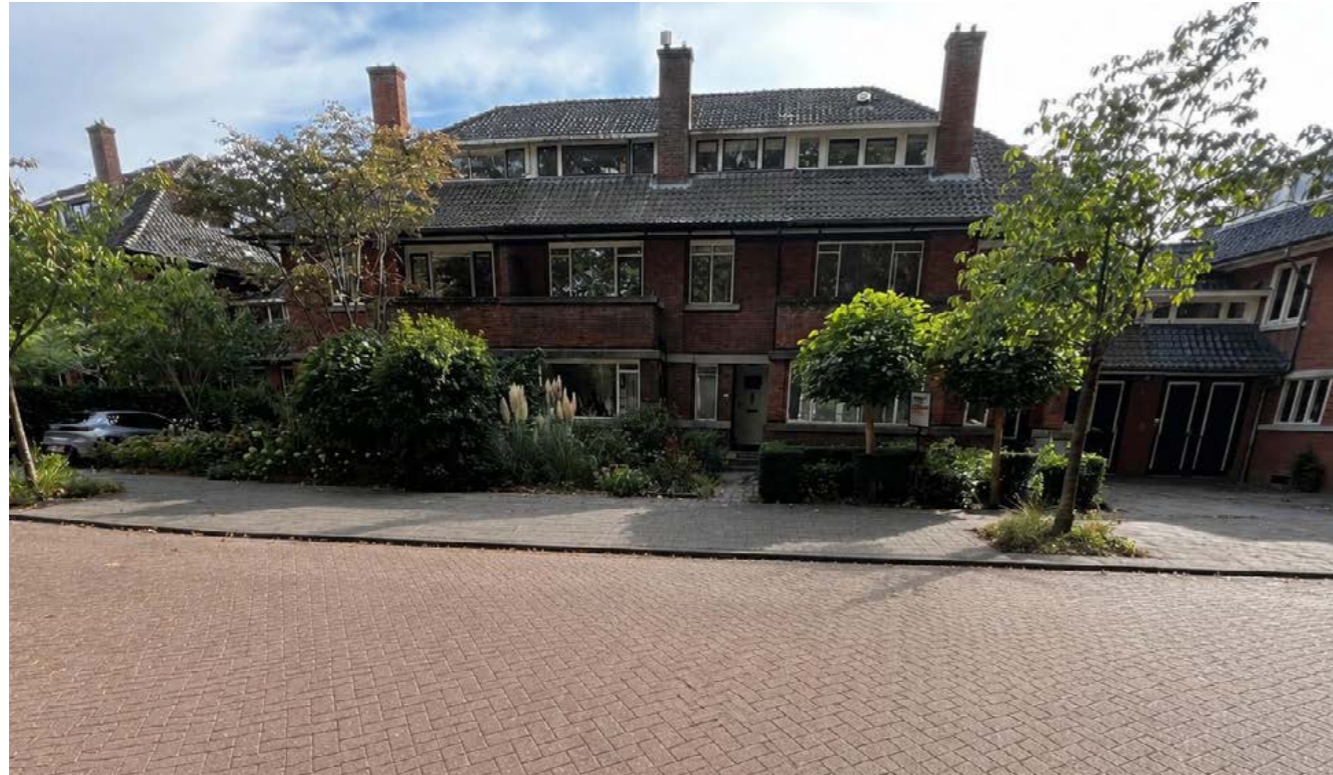
Statenlaan 21, Rotterdam