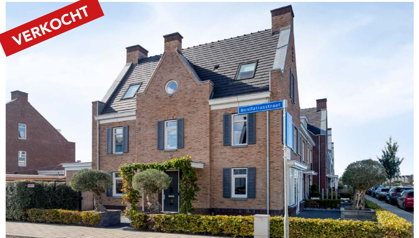
Bonifatiusstraat 1, Rijnsburg