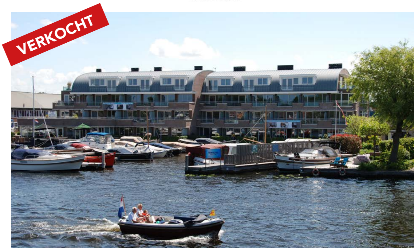
Veerpolder 1, app. 17, Warmond