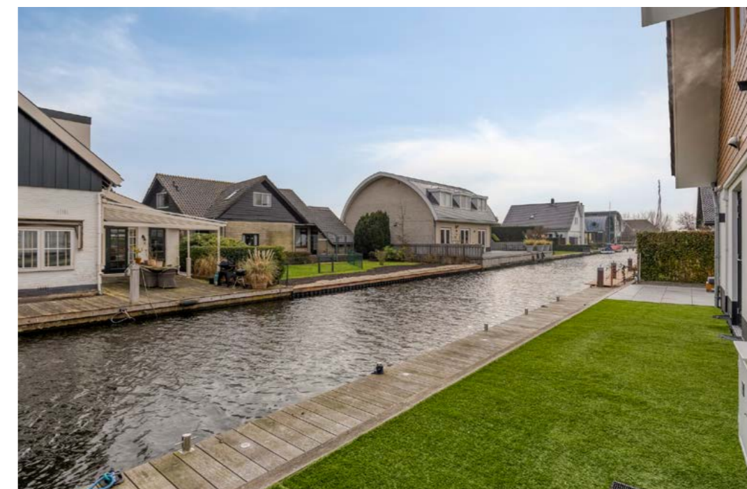
Emmalaan 7, Kaag