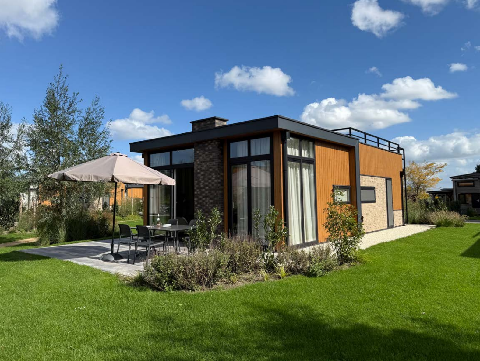
Boekhorsterweg 21, woning 132, Warmond