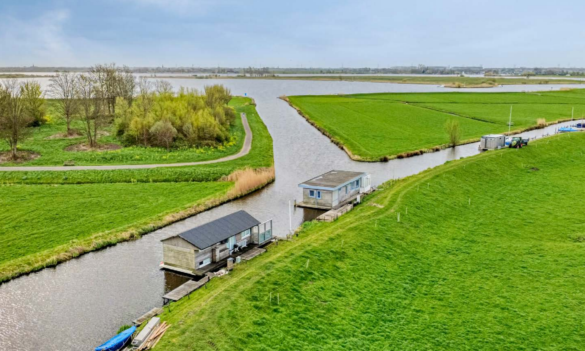
Hemmeerpolder 14, Warmond

Hemmeerpolder 14, Warmond Vraagprijs: € 695.000 k.k.