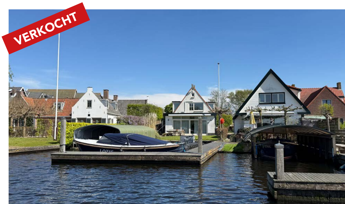
Julianalaan 38, Kaag